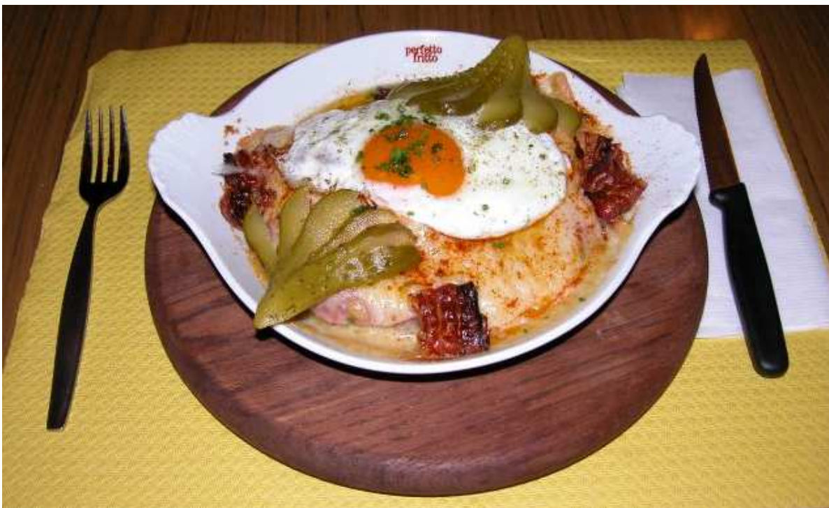
Unsere leckere Käseschnitte

Wir heissen Euch herzlich im Schützenstübli willkommen.