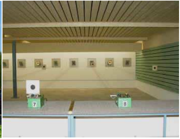
Unsere moderne 50/25/10 Meter Schiessanlage Der unterirdische 10 Meter Stand